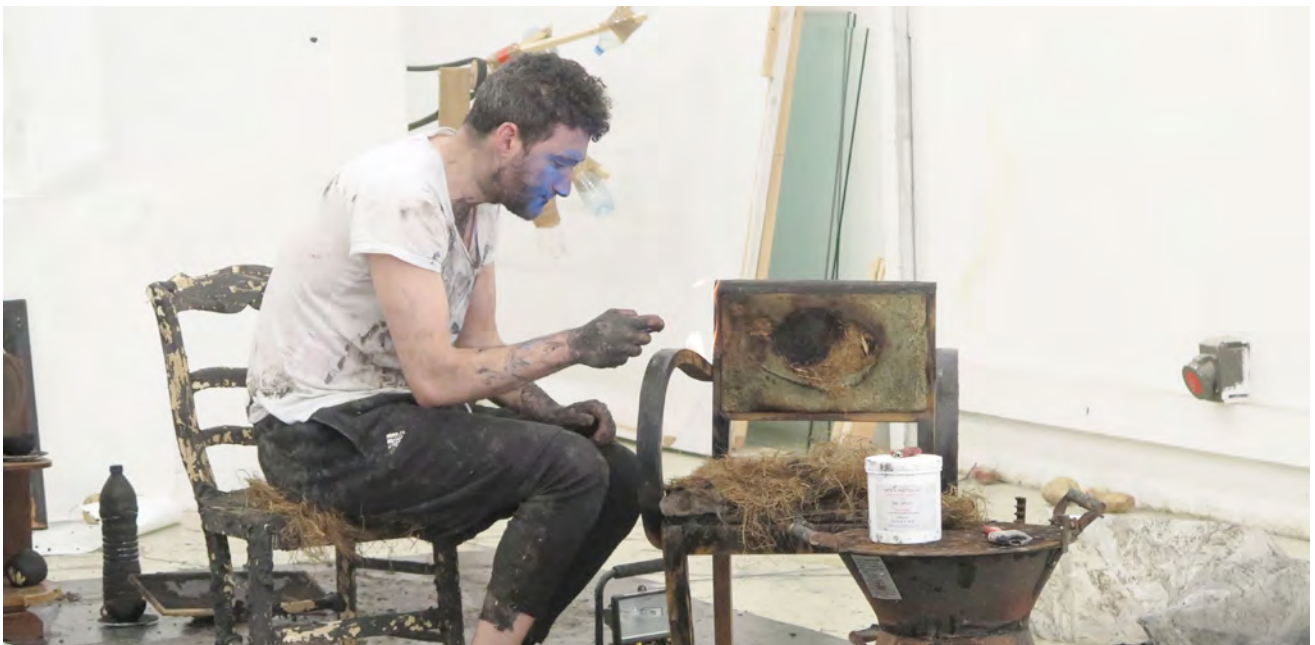
(Photo de répétition dans le cadre d'une résidence aux Beaux-Arts de Lorient, février 2017)

Tout cela pris dans un noir profond, un monochrome abyssal, dans lequel tout peut disparaître, se dissoudre, se confondre, être avalé puis être recraché, pris dans la machinerie musicale de la métamorphose.