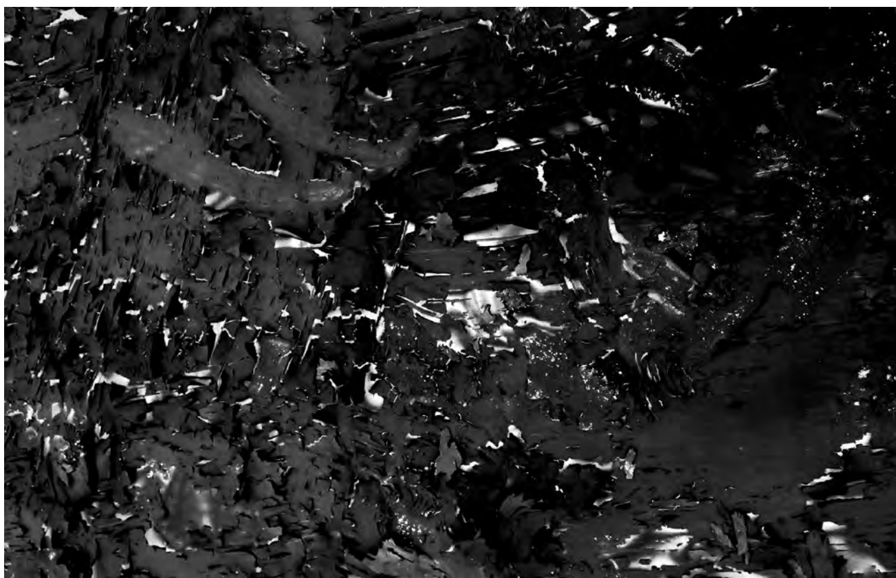
Essai de matière craquelée pour le sol, peinture pigmentée et terre séchée, Beaux-Arts de Lorient, février 2017

Cette chambre, c'est une chambre d'échos, une chambre « noire », comme dans la technique de photo argentique qui révèle, qui accueille des réminiscences ; une chambre qui contient des fantômes, des images survivantes, des engrammes.