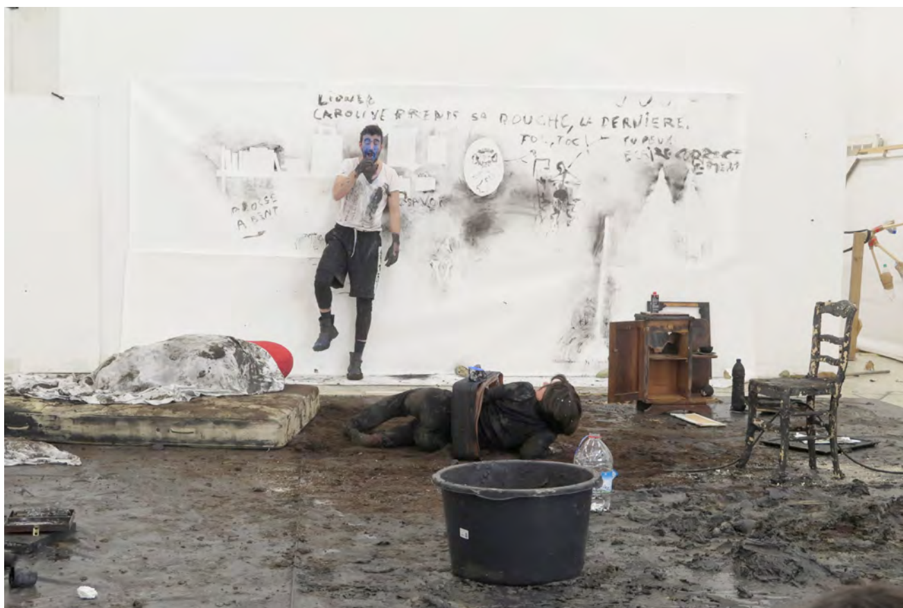
(Photo de répétition dans le cadre d'une résidence aux Beaux-Arts de Lorient, février 2017)

Il s'agira pour le théâtre de faire mouvement : la Demi-Véronique est le nom d'une passe en tauromachie, durant laquelle le torero absorbe le taureau dans l'éventail de sa cape, le conduit dans une courbe serrée jusqu'à sa hanche, en contraignant l'arrêt de sa charge. Comme le soupir en musique, c'est une pause, un silence dans l'exécution du mouvement et une transition.